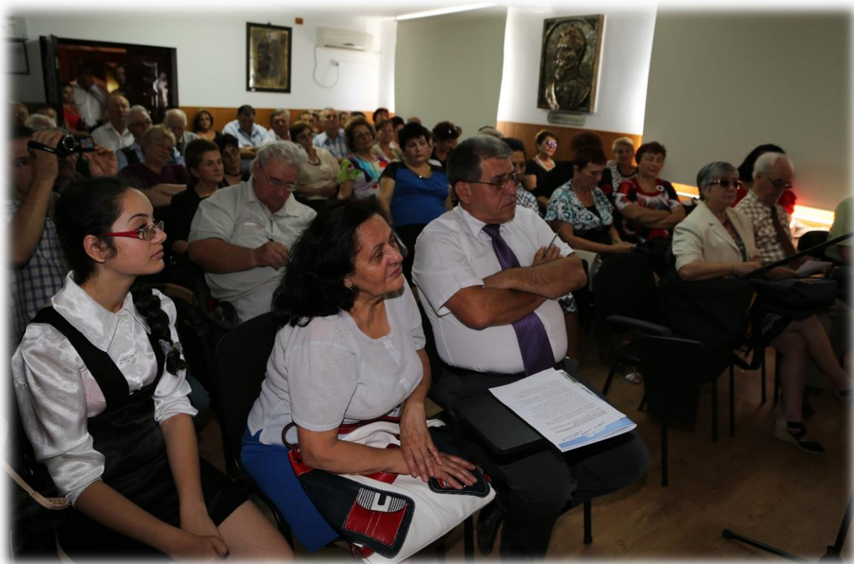
Membri C.A.R.P. "Elena Cuza " Bârlad audiind Conferința dedicată Zilei Limbii Române, 29 august 2014