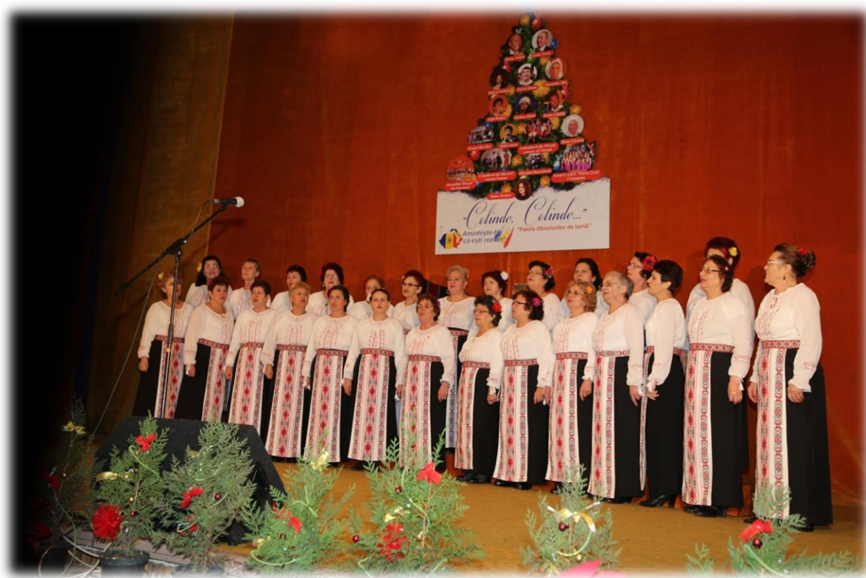
Corul "Crizantema" al Casei de Ajutor Reciproc a Pensionarilor "Elena Cuza" Bârlad