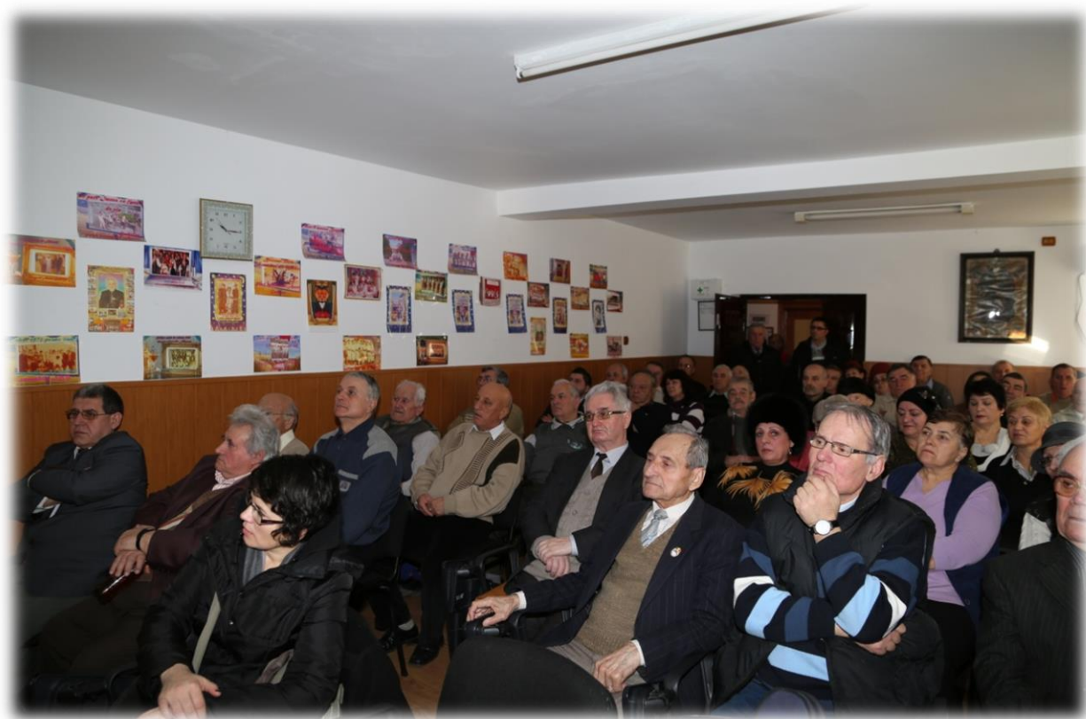
Membri C.A.R.P. "Elena Cuza" Bârlad asistând la una din numeroasele conferințe dedicate lor

Magazinul de pompe funebre din incinta Casei de Ajutor a Pensionarilor "Elena Cuza" Bârlad pune la dispoziția membrilor produsele necesare unei înmormântări ca: sicrie, îmbrăcăminte, coroane, jerbe, cruci, lumânări artisanale, transport capelă, transport înmormântări, prosoape, produse alimentare, cărbuni, tămâie, etc. În anul 2014 , volumul de desfăcere al acestui magazin s-a ridicat la suma 109.749 lei .